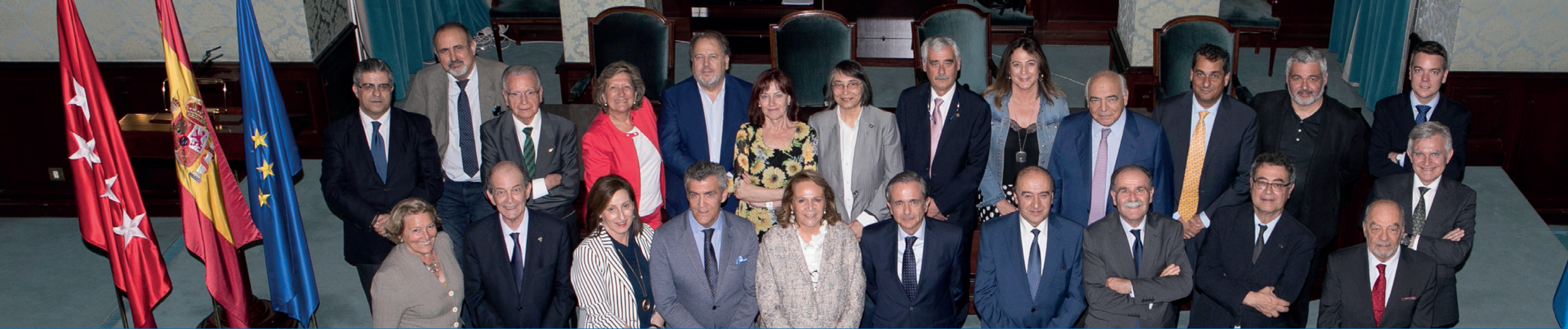
Asamblea Conferencia de Consejos Sociales de Universidades Españolas