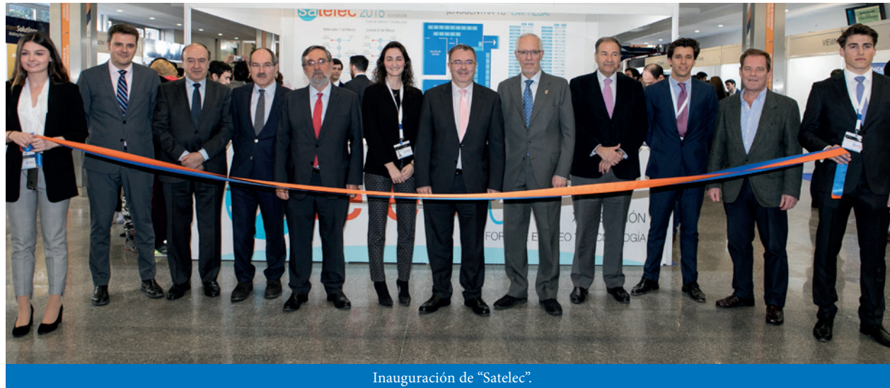
Inauguración de "Satelec".

Financial and Liquidation Report on the 2018 Budget of the Social Council. (Approved at the 1/2019 Plenary Session).