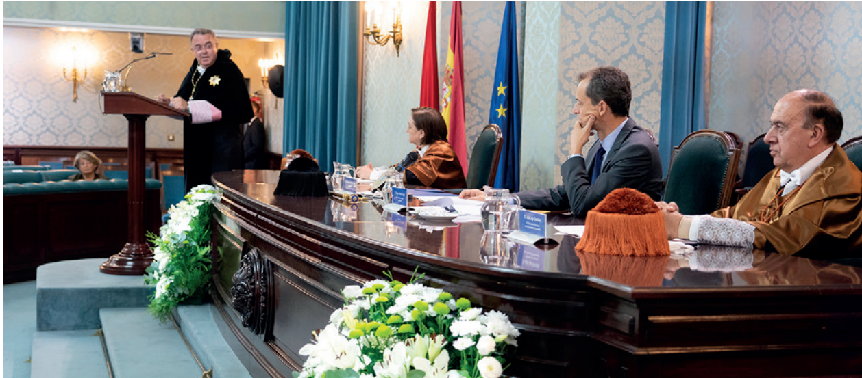
Apertura de Curso 2018-19