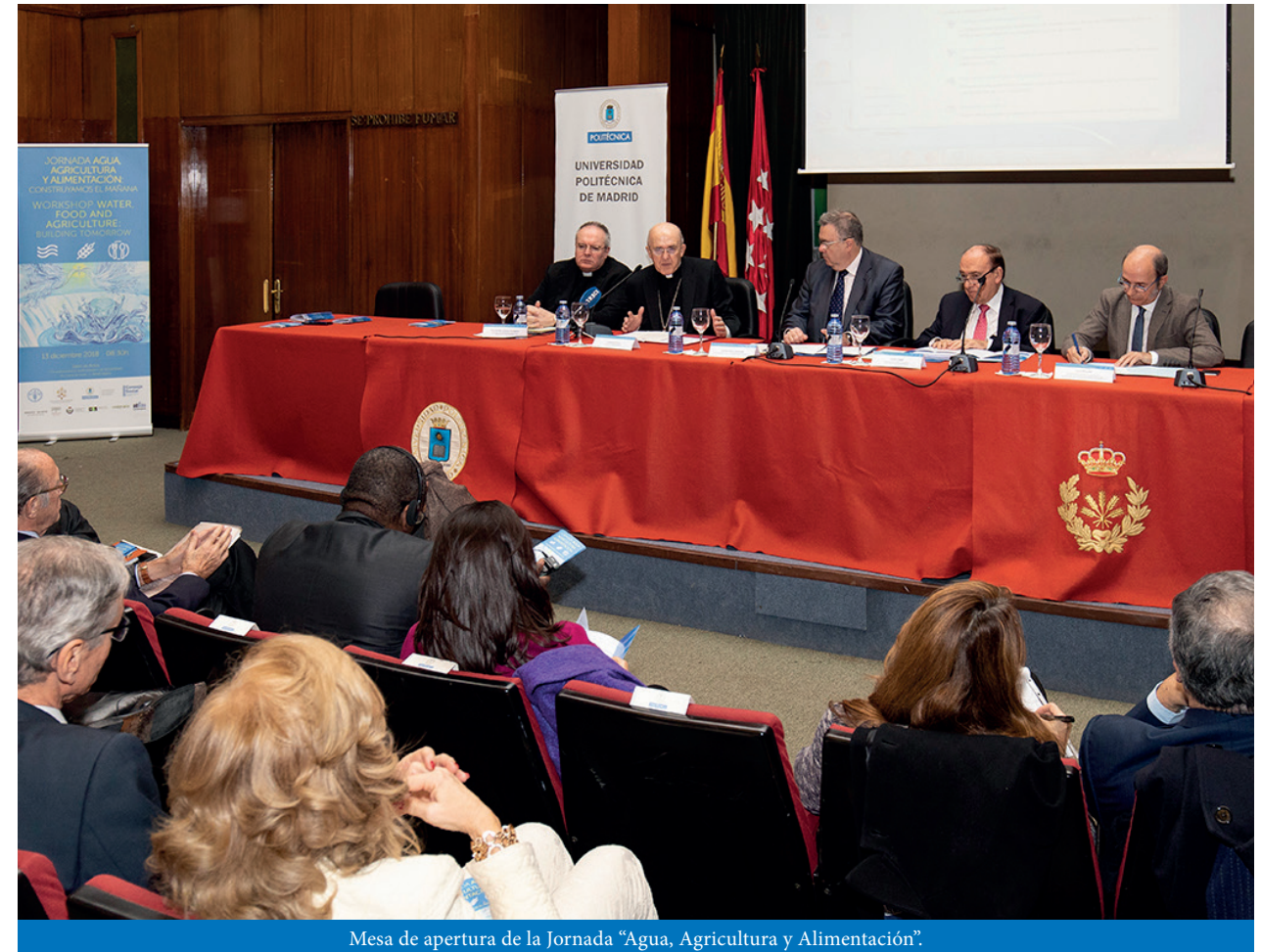
Mesa de apertura de la Jornada “Agua, Agricultura y Alimentación”.

Con la creación y desarrollo de este Centro, al que el Consejo Social viene prestando su apoyo desde el año 2012, tanto institucional como económico, se ha creado en el seno de la UPM una red interdisciplinar de profesores, expertos e investigado-