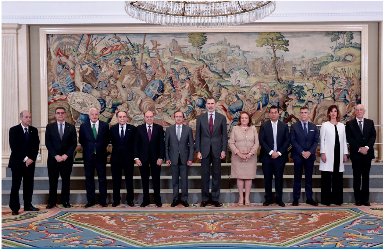
Audiencia del Rey con el Comité Ejecutivo de la Conferencia de Consejos Sociales de Universidades Españolas