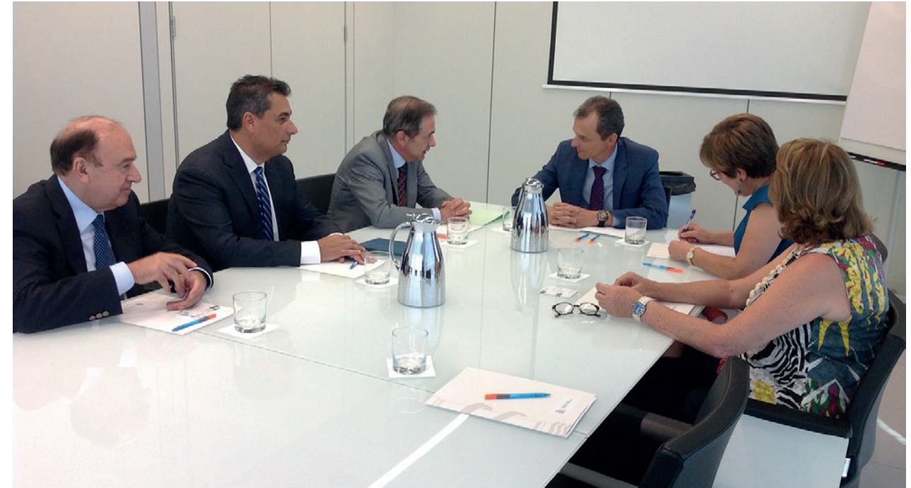
Entrevista del Comité Ejecutivo de la Conferencia de Consejos Sociales con el Ministro de Ciencia y Tecnología.

En la sesión mantenida en la segunda de las reuniones, tuvo lugar la presentación del estudio, "Una aproximación a los Sistemas de Financiación de las Universidades Públicas Españolas"